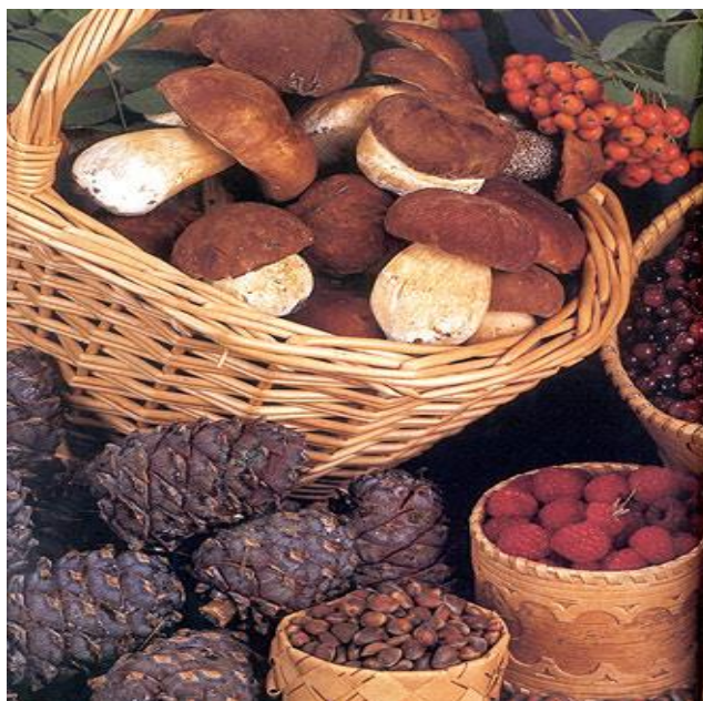
Карточка № 3

Как помогает лес вылечиться? Как можно по-другому назвать лес?