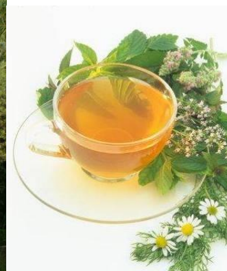
Карточка № 4